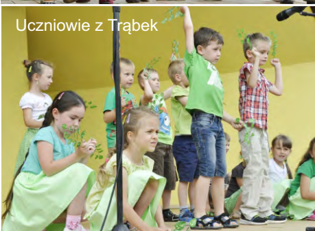
Uczniowie z Trąbek