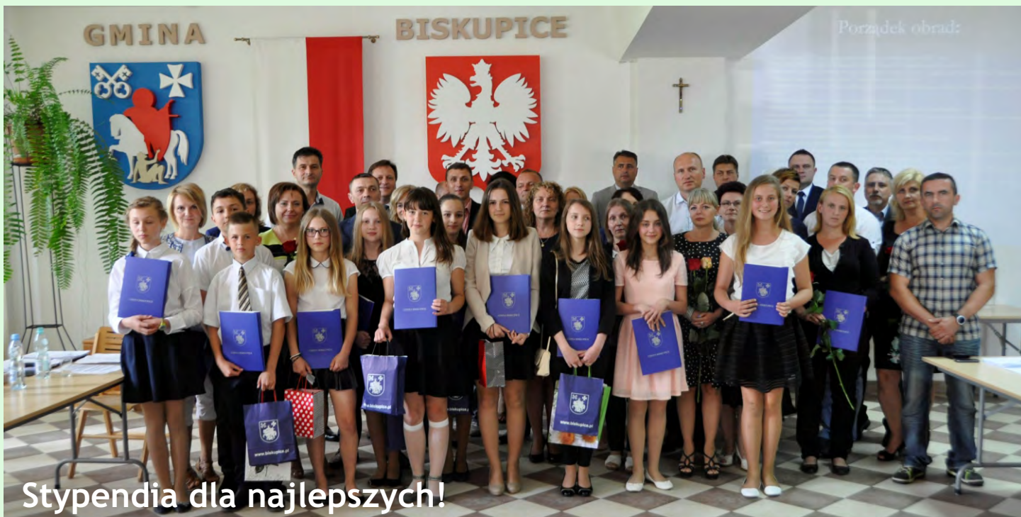
Stypendia dla najlepszych!