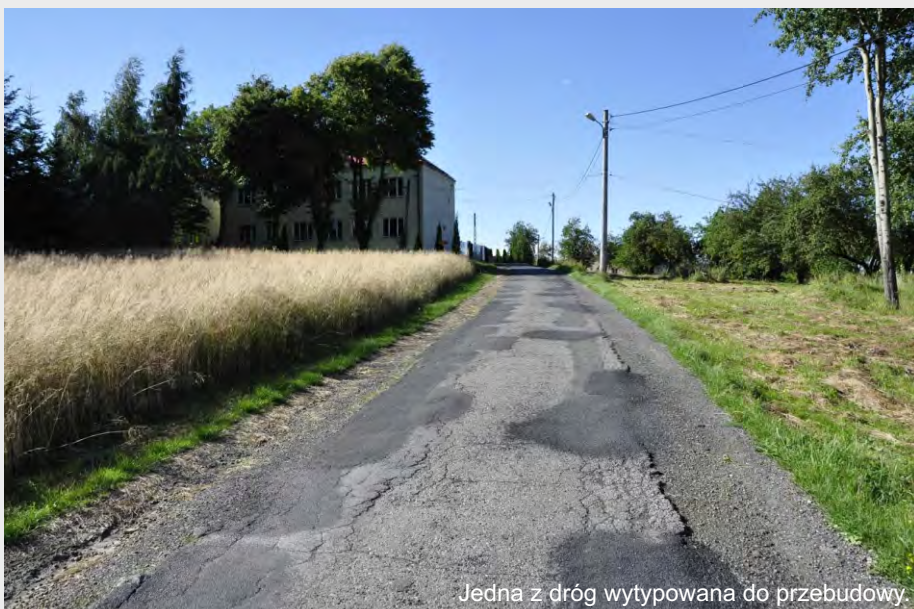
Jedna z dróg wytypowana do przebudowy

gaci zakres prowadzonej terapii o wyjazd usamodzielniające dla uczestników. Łączny koszt realizacji projektu to 133 000 zł. Wnioskowana kwota dofinansowania ze środków PEFRON: 79 800 zł. Pozostała część 53 200 zł to środki własne.