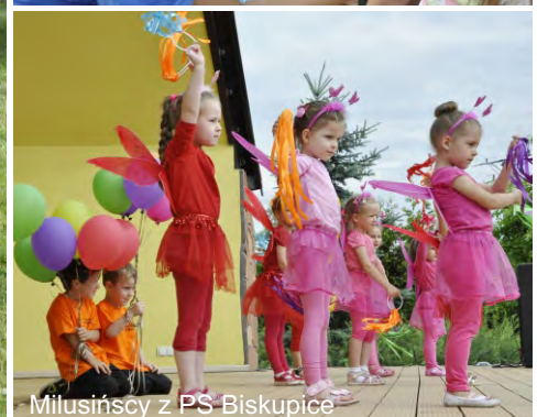
Milusińscy z PS Biskupice