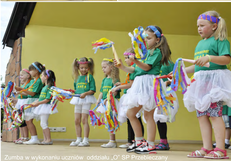
Zumba w wykonaniu uczniów oddziału „O” SP Przebieczany