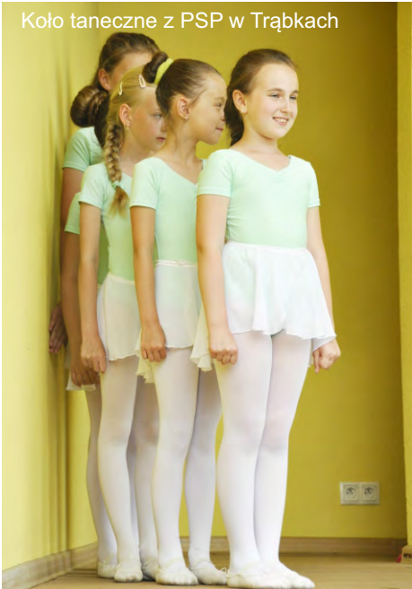
Koło taneczne z PSP w Trąbkach