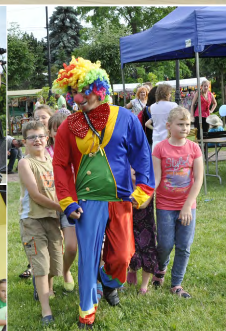
Widowisko plenerowe Teatru „Muza”