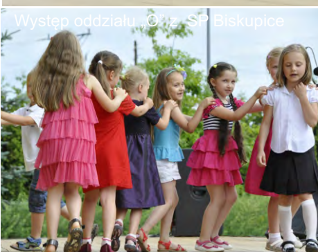
Występ oddziału „O” z SP Biskupice