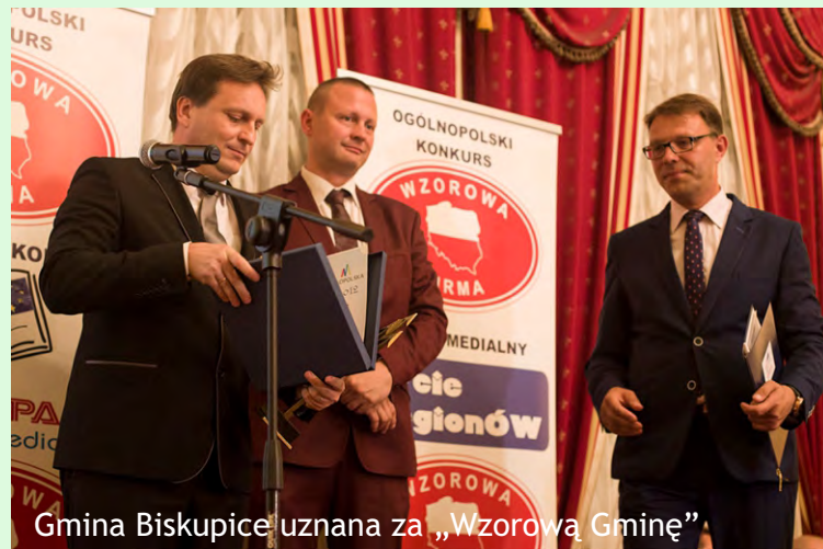
Gmina Biskupice uznana za „Wzorową Gminę”