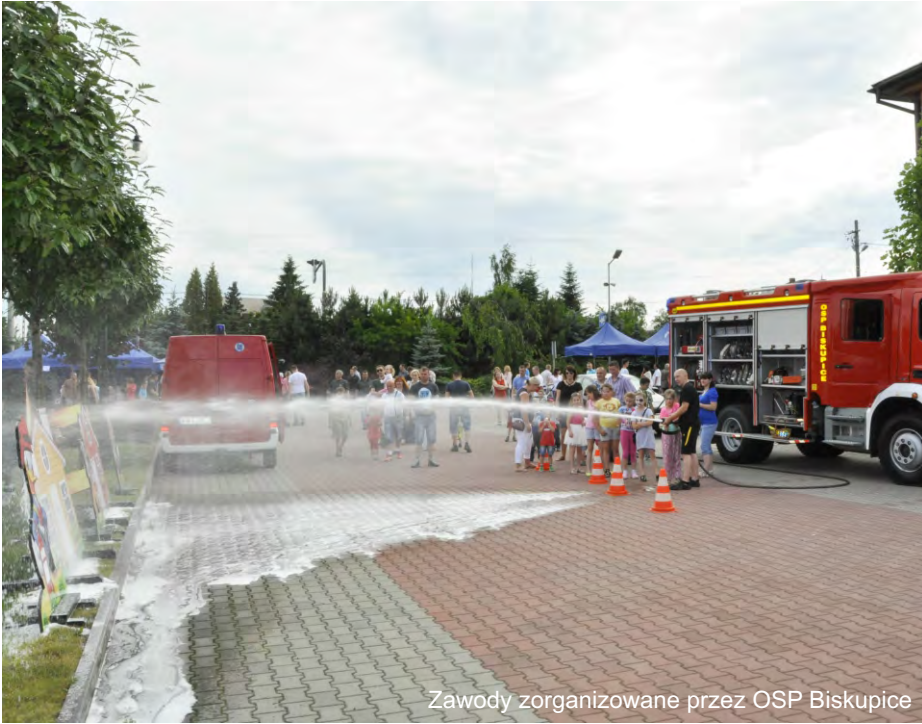
Zawody zorganizowane przez OSP Biskupice