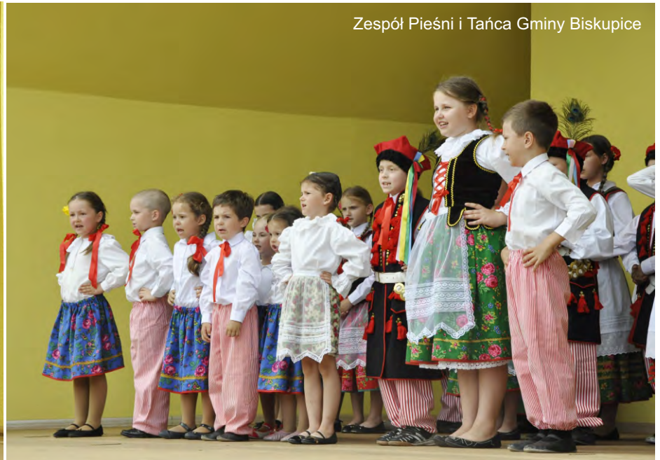
Zespół Pieśni i Tańca Gminy Biskupice