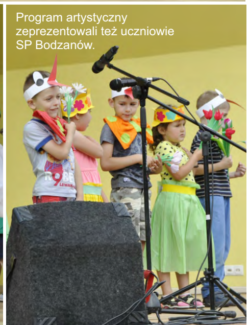
Program artystyczny zeprezentowali też uczniowie SP Bodzanów.