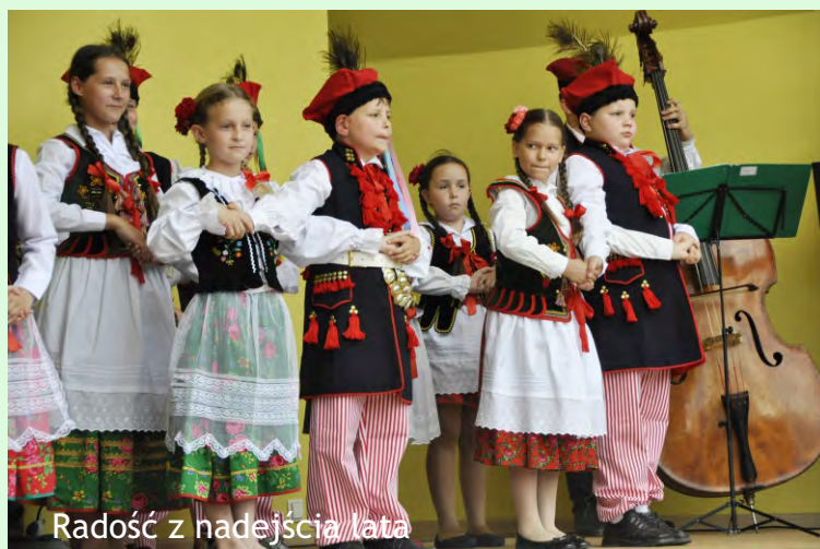
Radość z hudejścia