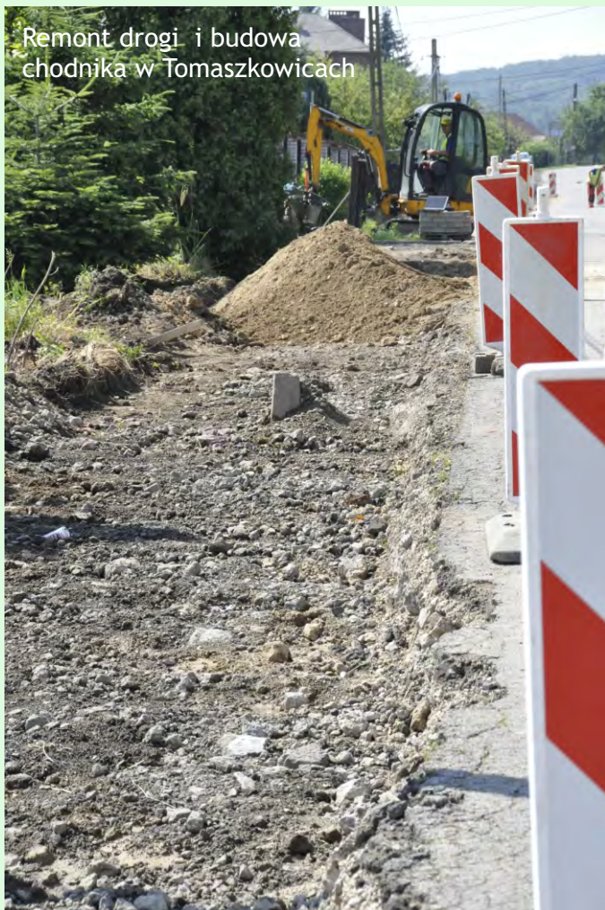
Remont drogi i budowa chodnika w Tomaszkowicach