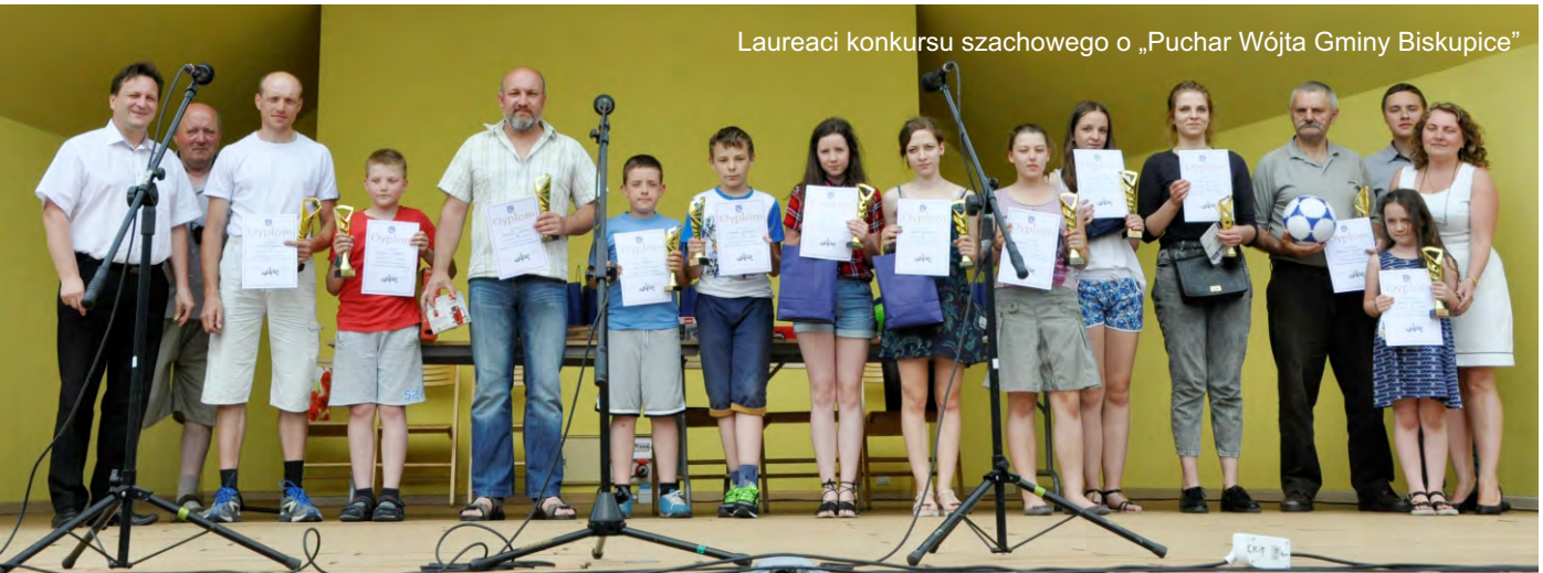
Laureaci konkursu szachowego o „Puchar Wójta Gminy Biskupice”