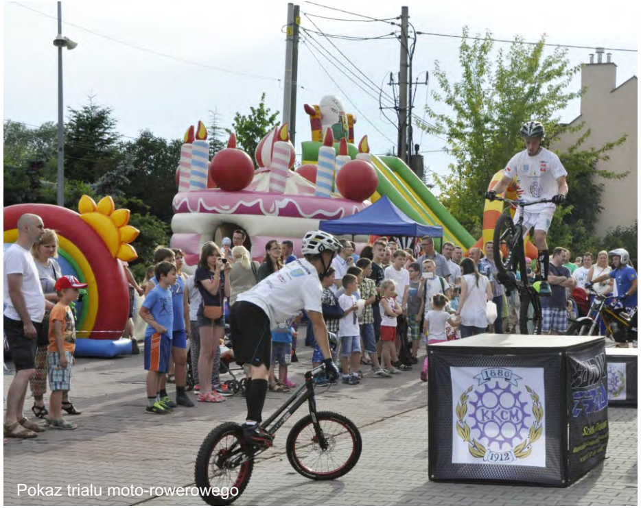
Pokaz trialu moto-rowerowego