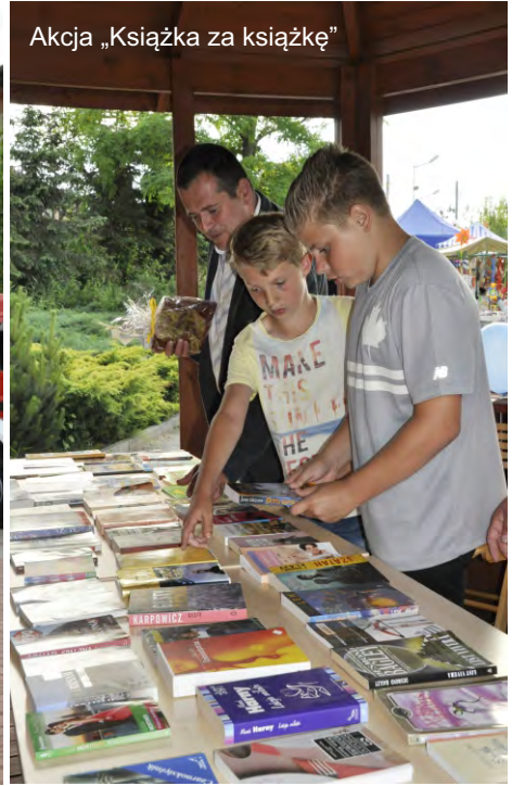
Akcja „Książka za książkę”